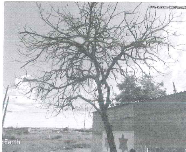
Figura 1 – Espécime morto.

Diante disso e considerando o risco de queda com danos a transeuntes e veículos, fica recomendada o desmonte do espécime.